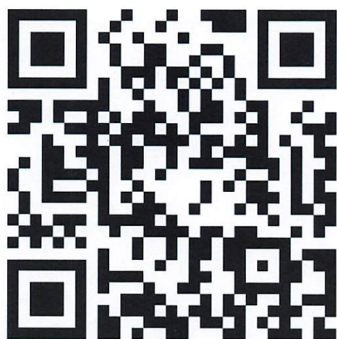
决赛参赛回执二维码