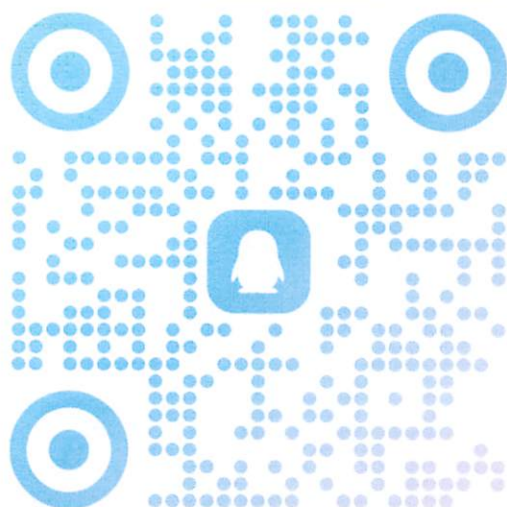
决赛 QQ 群二维码